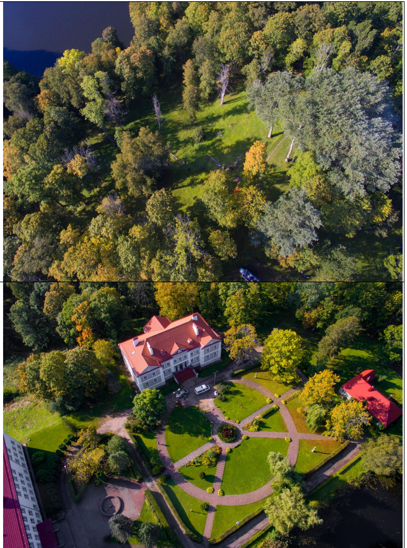
Unikalus kodas Kultūros vertybių registre 23503